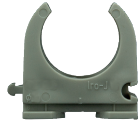
M16 - M 40