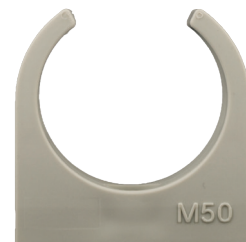
M50 - M 63